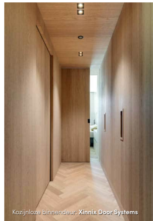
Kozijnloze binnendeur: Xinnix Door Systems