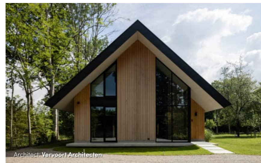
Architect: Vervoort Architecten

vlakken van het dak zijn bewust dun gehouden, met zo min mogelijk details. Er zijn geen dakopeningen, geen dakkapellen. Op enkele plaatsen sluit het dak aan op het gevelvlak en raakt het het maaiveld. Daarmee maakt het onderscheid tussen enerzijds de entreezone en anderzijds de leefruimtes. Het resultaat is een bescheiden villa met een heldere vormtaal en een eerlijk karakter.