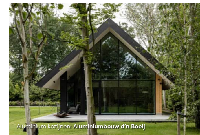
Aluminium kozijnen: Aluminiumbouw d'n Boeij