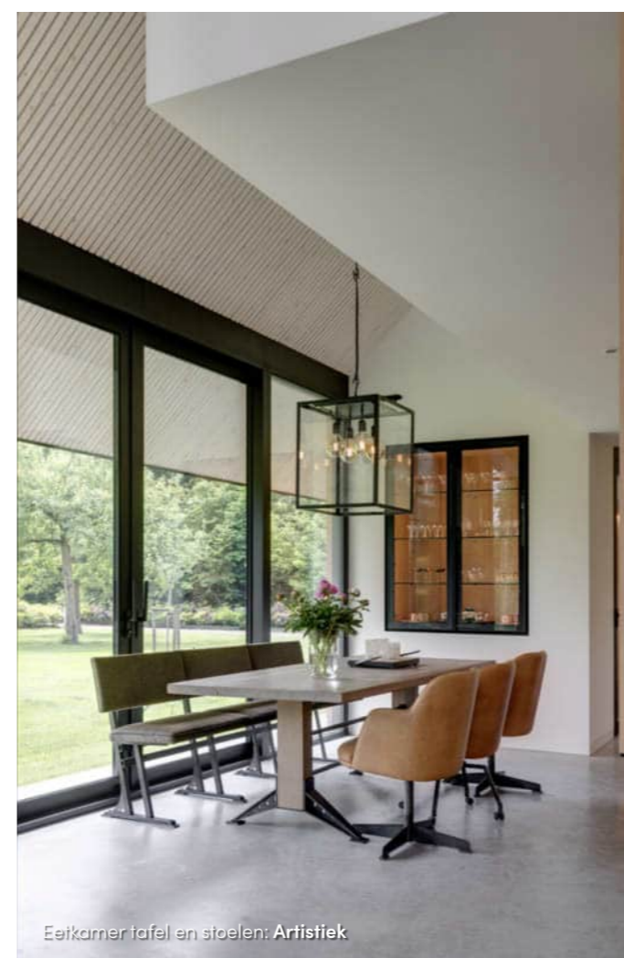
Eetkamer tafel en stoelen: Artfstiek

De bewoners wilden een nieuw huis, maar niet zonder hun eigen geschiedenis achter zich te laten. Zo werd een aantal van hun vorige meubels meegenomen en werden toekomst en verleden met elkaar verbonden. “Duurzaam en liefdevol omgaan met spullen, dat past ook bij onze manier van ontwerpen”, vertelt Eva. “We duiken de diepte in en terug. Zo zijn we altijd aan het verbeelden. Op die manier krijgen de details een plek: waar komen de haarden, de kasten, de koffiehoeke? In deze Engelse kamer vind je volop verrassingen: een zitvenster in het raam, een geheime kist, een tv die met een druk op de knop uit het houtwerk tevoorschijn komt, en een verborgen deur.” “Het interieur staat niet alleen gevoelsmatig symbool voor het leven in een kajuit, maar bezit ook de slimmigheid van een boot”, legt Anneke uit.