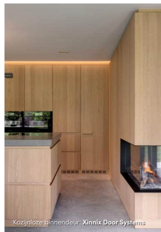
Kozijnloze binnendeur: Xinnix Door Systems