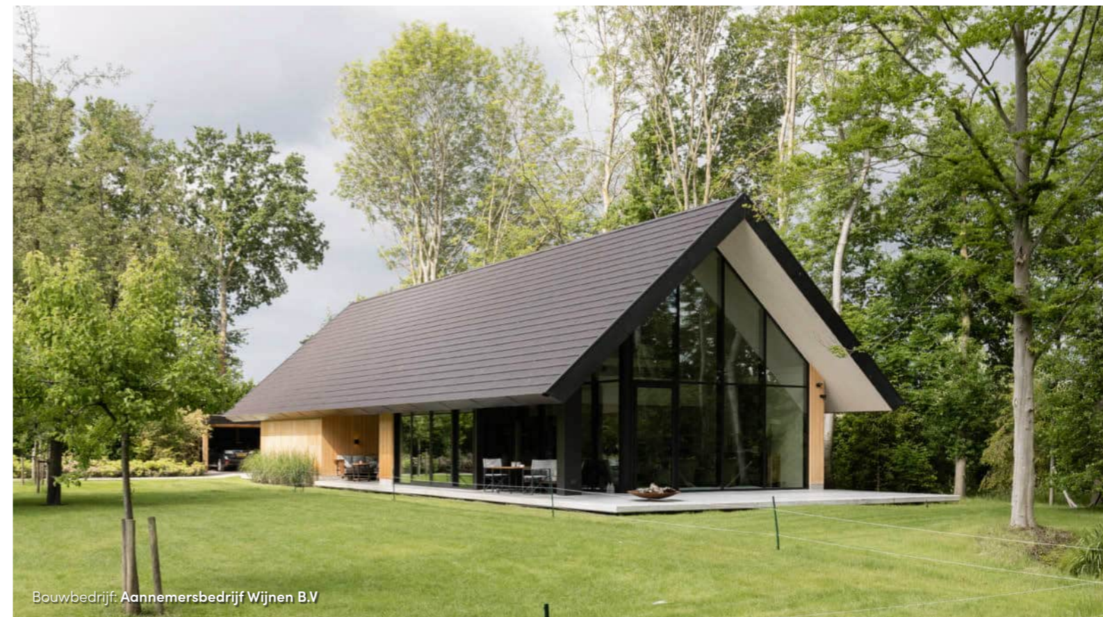
Bouwbedrijf: Aannemersbedrijf Wijnen B.V

veel materialen met elkaar te combineren. In dit project hebben we gekozen voor hout, beton en wit stucwerk als hoofdtonen. Zwart komt niet in de natuur voor, daarom kozen we voor een donkere kleur die het zwart benadert, maar heel warm oogt als het licht erop schijnt. De dakpannen zijn in dezelfde warme tint. Zo oogt de woning niet hard en past deze in de omgeving." De